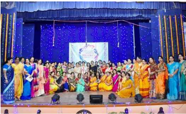
Bandhu Milan of HAL Sunabeda Ladies Club & Nalco Ladies Club Damanjodi