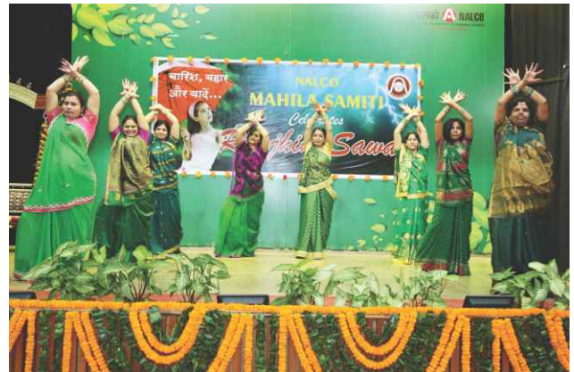
Nache Gaaye Mouj Manaye"