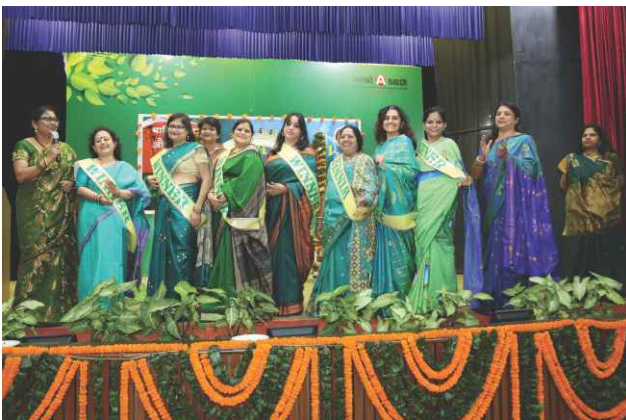
I am SHE ... but we can bring a sea change the world will see