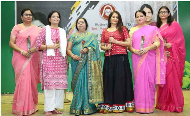
Good Teacher + Good Students = Good Nation