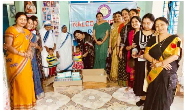
Social work at home for dying destitute and Shishu Bhawan of Koraput.