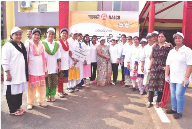
Towards positive social change - Swachhata Drive