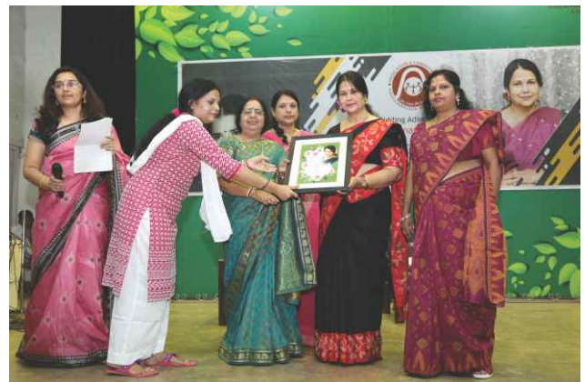
Meeting and parting are the ways of life... but love is eternal