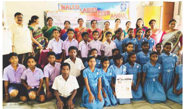
Child safety awareness programme at Banarpal Shevashram School