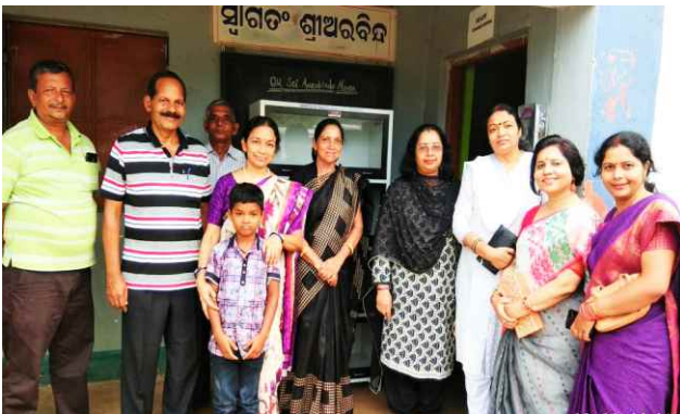
Social work at Podagada Primary School at Koraput