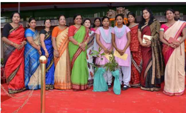
Study assistance to Class-XII girls of SVM