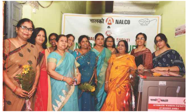
Donation of clothes & washing machine for the mentally retarded inmates of 'ASHRA'