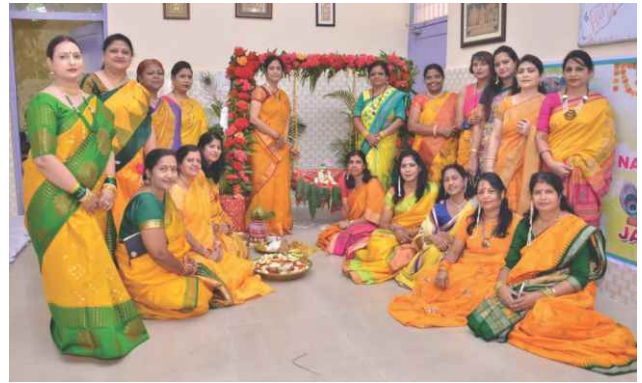
Celebration of Janmastami