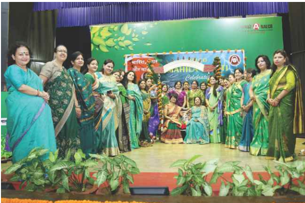
"Sawan Ke Sath Aao Jhume"