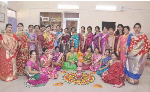
Celebration of Navaratri