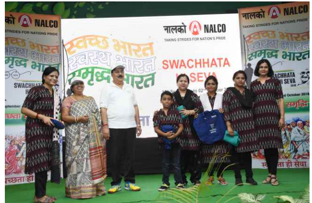
The environment is in a whirl of fury of wronged action... participants of 'SKIT' find a solution out