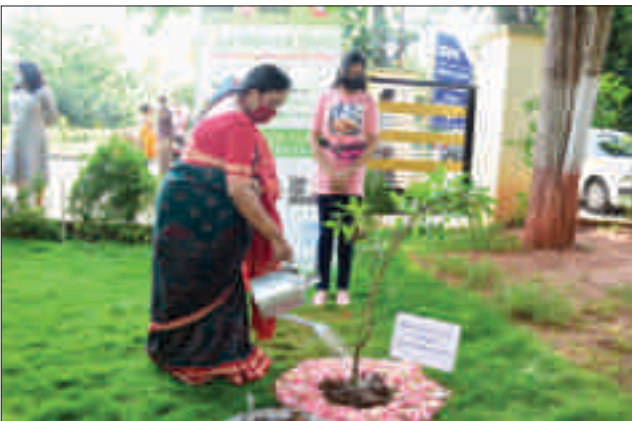
'विश्व पर्यावरण दिवस' के अवसर पर नालको महिला समिति की अध्यक्ष महोदय द्वारा वृक्षारोपण