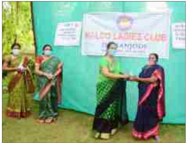
हैंड सैनिटाइज़र और मास्क का वितरण