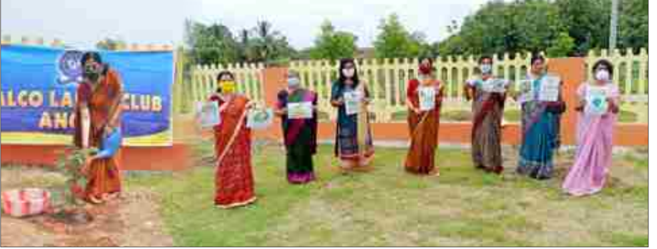
'विश्व पर्यावरण दिवस' समारोह