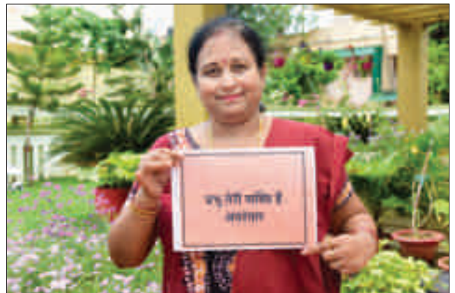
कोविड जागरूकता अभियान