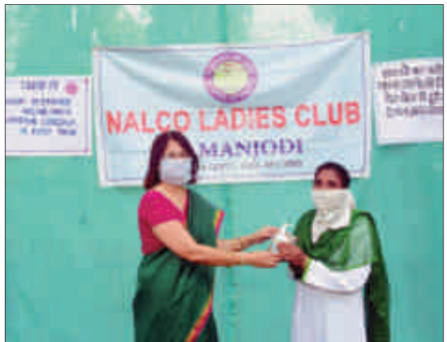
हैंड सैनिटाइज़र और मास्क का वितरण