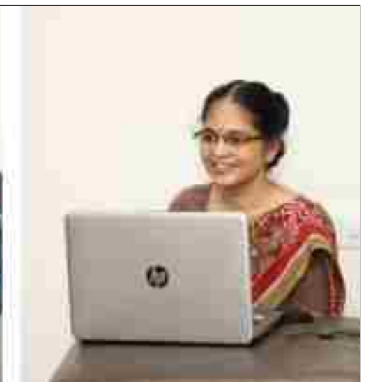
कोविड-१९ के दौरान 'मानसिक स्वास्थ्य संतुलन' आधारित वेबीनार