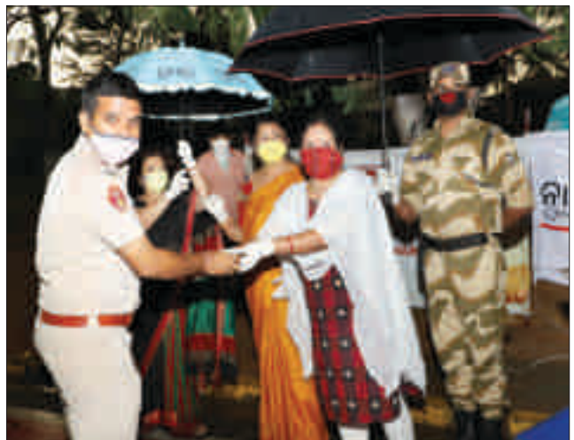
लॉकडाउन के दौरान आयुक्तालय पुलिस को खाद्य सामग्री वितरण