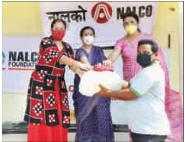
स्थानीय मजदूरों को खाद्य सामग्री वितरण