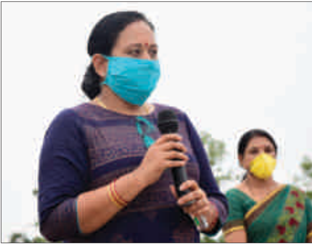
कोविड जागरूकता अभियान