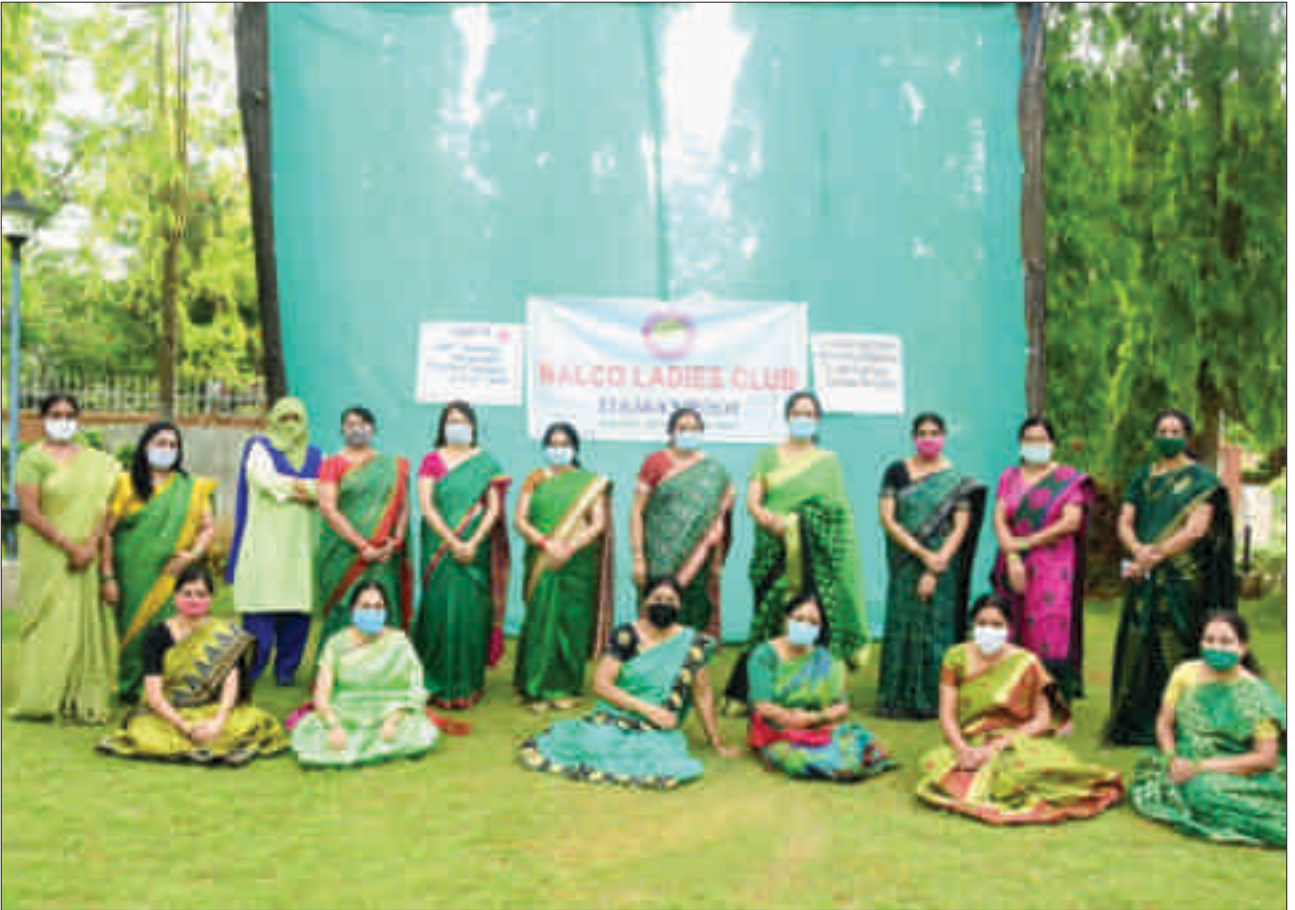
'विश्व पर्यावरण दिवस' समारोह