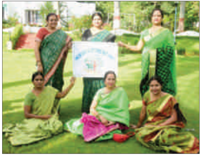
'विश्व पर्यावरण दिवस' समारोह