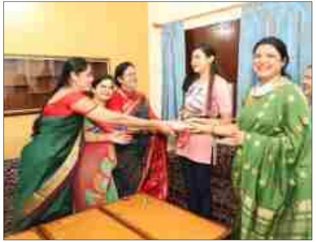
प्रतिष्ठित अतिथि के साथ अविस्मरणीय क्षण