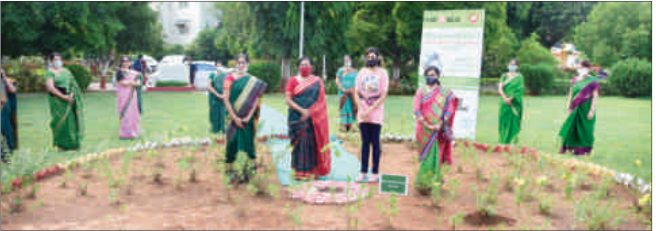
'विश्व पर्यावरण दिवस' के अवसर पर वृक्षारोपण