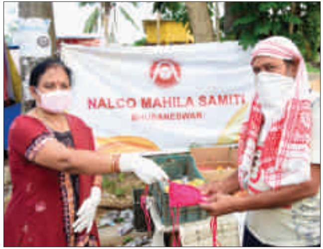
प्रवासी मजदूरों को मास्क वितरण