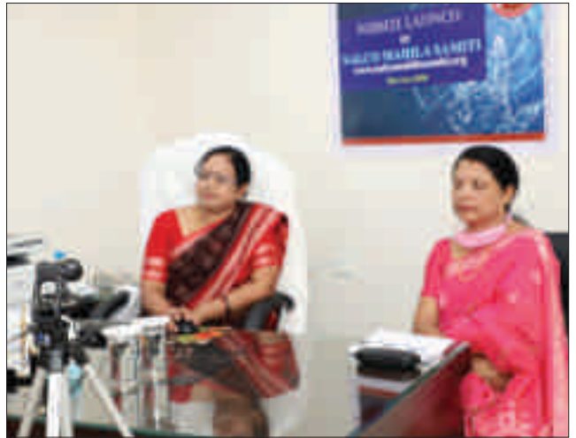
'नालको महिला समिति' की वेबसाइट का उद्घाटन