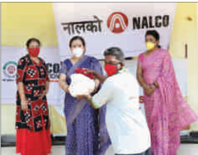
प्रवासी मजदूरों को खाद्य सामग्री वितरण