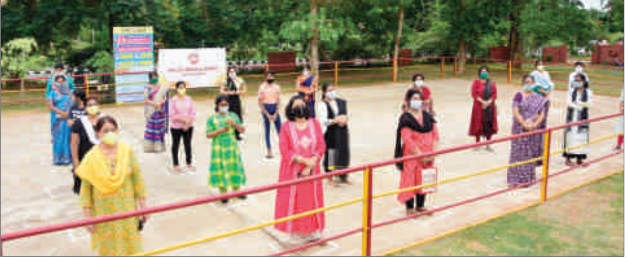
कोविड योद्धाओं के समर्थन में 'बंदे उत्कल जननी' का गान