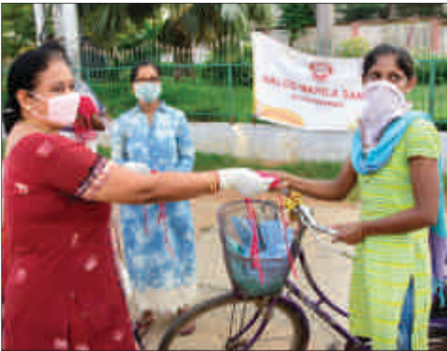
स्थानीय मजदूरों को मास्क वितरण