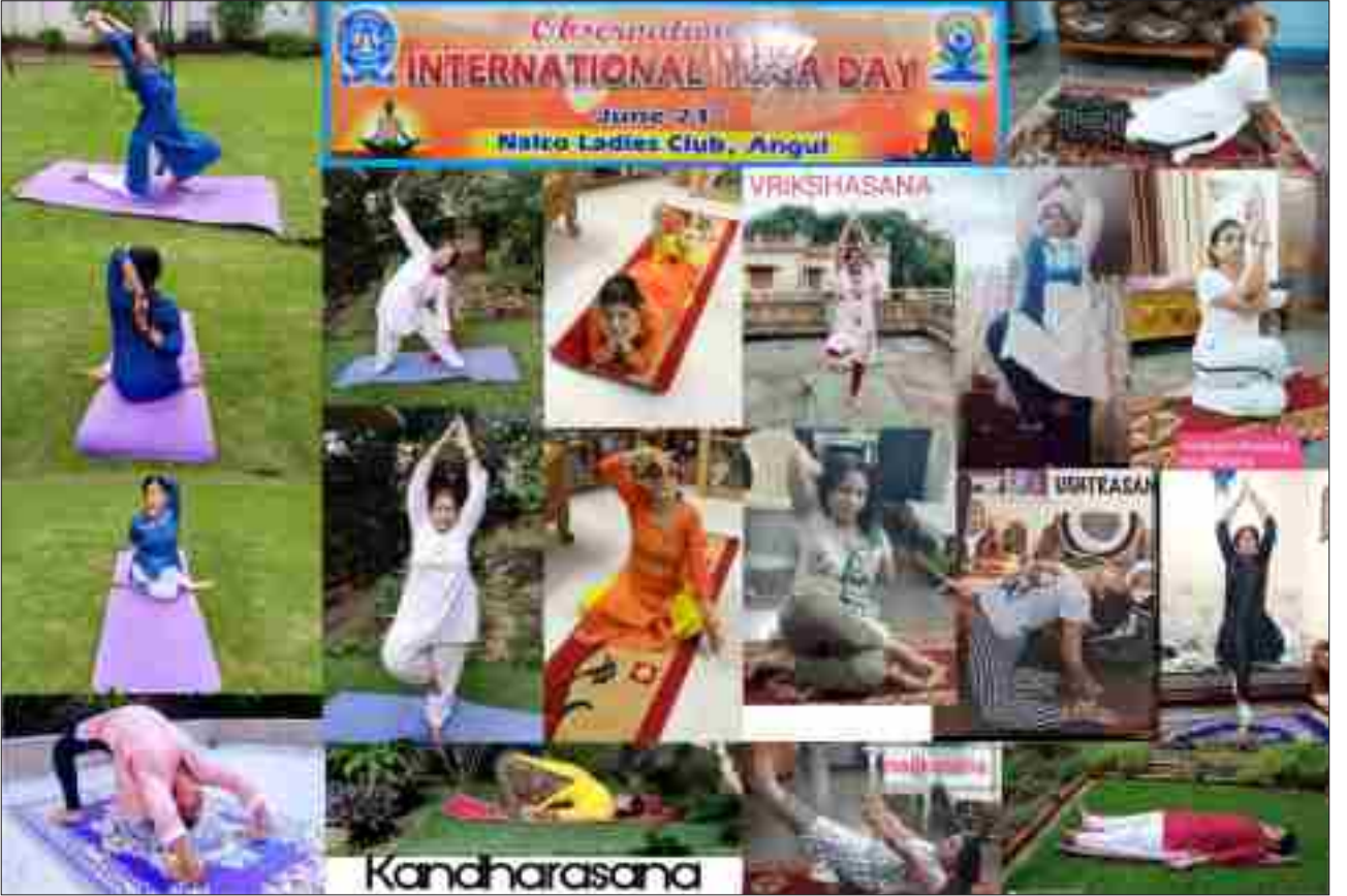
'अंतर्राष्ट्रीय योग दिवस' समारोह

Readers are requested to send their write ups, suggestions and feedback to nmssangini@gmail.com in clear handwriting or soft copy before 30 th September 2020. - Editor-in-Chief