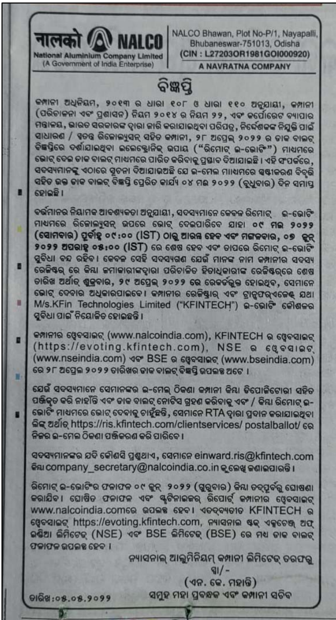
Sambad dated 06.05.2022