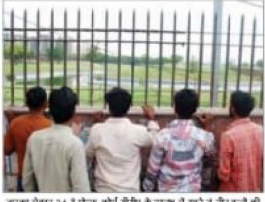
दूरतका सेक्टर 24 में रिजल्ट डीडीए के तालाब में घुसे ने तीन बच्चों की मौत का घटनाक्रम की खबर की। -आई एनएसएस