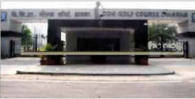
सुरक्षा सेक्टर 24 में रिजल्ट डीडीए गोल्फ कोर्स के तालाब का नया टैंक देखा जा रहा है।

त्रयी से रहत की तलाश बनी जानल्ला, दूरतका सेक्टर-24 रिजल्ट डीडीए गोल्फ कोर्स में ह्यू दूरतका हदसे ने सुरक्षा इंतजामों की गंभीर खातिरों की कड़ा उजागर, इसी तालाब में पहले भी हो चुकी है ऐसी ही घटनाएं